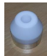
Schweißschuh rund 30mm