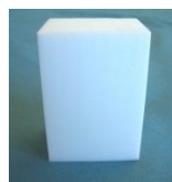
PTFE - Block