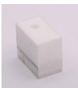
Schweißschuhrohling Typ 1 – 30 x 50mm Typ 2 – 40 x 52mm Typ 3 – 90 x 70mm