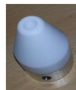
Schweißschuh rund 20mm