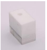
Nozzle blank Type 1 – 30 x 50mm Type 2 – 40 x 52mm Type 3 – 90 x 70mm