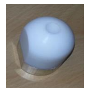
Schweißschuh rund 40mm